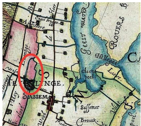
Afb.1: Het oorspronkelijke kernbezit van de Heren van Teylingen, 'De Heemwerf en de zes morgen'. Fragment van de kaart van Rijnland door Floris Balthasars uit 1615.

niet meer terug. In 1198 krijgen we vaste grond onder de voeten als de vermeende zoon van Hugo, Willem I van Teylingen, getuige is bij een oorkonde die is uitgevaardigd door graaf Dirk VII te Lisse. Deze Willem koos na het overlijden van Dirk VII in 1203 partij voor diens jongere broer, ook Willem genaamd, in de successieoorlog die daarop volgde. Deze oorlog zou bekend worden onder de naam 'Loonse oorlog'