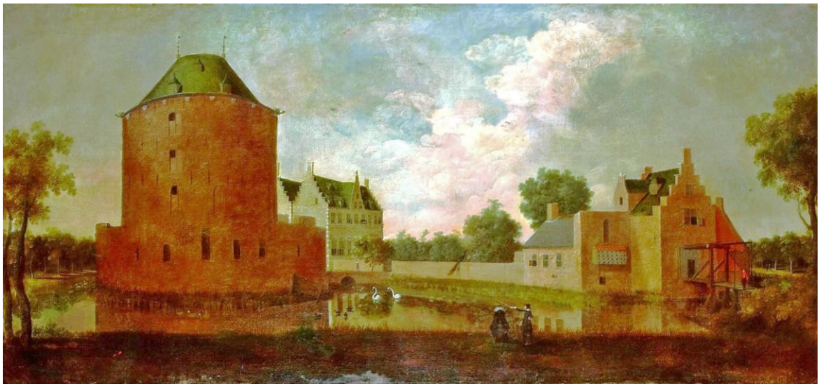
Afb.4: Teylingen in welstand rond 1660.

geheel verwijderd en vervangen door een gigantisch nieuw tweebeukig woonhuis, voorzien van trapegevels. Afb.4 laat slot Teylingen zien in al zijn grandeur van rond 1660 toen dit schilderij gemaakt is. Het voormalige poortgebouw in de ringmuur zou echter pas in 1663 tot jagershuis verbouwd worden en dat is hier duidelijk nog niet het geval. In 1676 zou een felle uitslaande brand de oude woontoren treffen, waarbij het interieur en het dak geheel verloren gingen. Het zou nooit meer opgebouwd worden. De gebouwen op de voorburch hebben het tot aan het begin van de 19 de eeuw uit kunnen houden en werden in 1803 gesloopt.