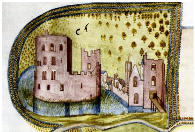
Afb. 3: De Heemwerf in 1596, door Simon Aernstz van Buningen. Het origineel bevindt zich in het Nationaal Archief in Den Haag, collectie Hingman 2317

Na het beleg van Haarlem lagen de oude ringburcht en de bijgebouwen er in 1573 niet al te florissant meer bij en de krijgsprikelen rond het beleg van Leiden deden daarna de rest (zie afb.3). Ook fungeerde het slot en de bijgebouwen ongetwijfeld als steengroeve voor omwonenden, die daar maar al te graag gebruik van gemaakt zullen hebben. Bij de laatste restauratie van de ringmuur van de oude Dorpskerk in 1988, bleek dat de oude ringmuur ooit gefundeerd moet zijn geweest op kloostermoppen afkomstig van slot Teylingen. Nadat onze streekgenoten waren bijgekomen van de laatste oorlogshandelingen, werd er eind 16 de en